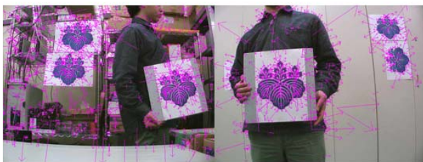
SIFTアルゴリズムによるkeyの算出結果