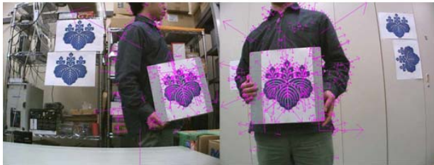
提案手法によるkeyの算出結果