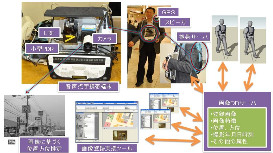
図 2.2 屋内外視覚障害者歩行支援システムの概要

視覚障害者歩行支援システムでは、現在位置や経路などのナビゲーション情報を音声と点字で利用者に提示している。また、6点式の点字キーを使って、歩行支援システムへの入力や各種操作を行えるようになっている。点字入力や点字出力、音声出力のために音声点字端末を使用している。音声点字端末は、計算処理能力が非力であるため、別途ノートPCを用意し、その上で画像認識や各センサの計算処理を行うようにした。音声点字端末にはユーザインタフェース部分のみ実装し、ノートPCは背中に背負うリュックに格納した。LRF、カメラ、小型PDR、音声点字端末は専用のハーネスに固定し、体の前の部分にぶら下げる形にした。図 2.2 に本研究で試作した屋内外視覚障害者歩行支援システムの概要を示す。