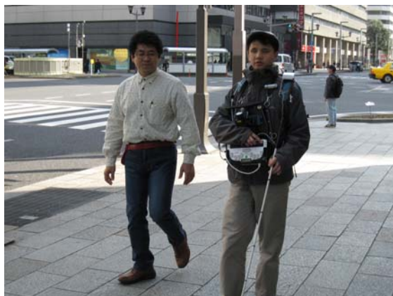
図 3.2 統合モニタ実験の様子

統合モニタ実験の際に被験者が歩行支援システムを使っている様子を図 2.3 に示す。被験者の安全を確保するため、実験中は被験者に実験補助者が同行している。