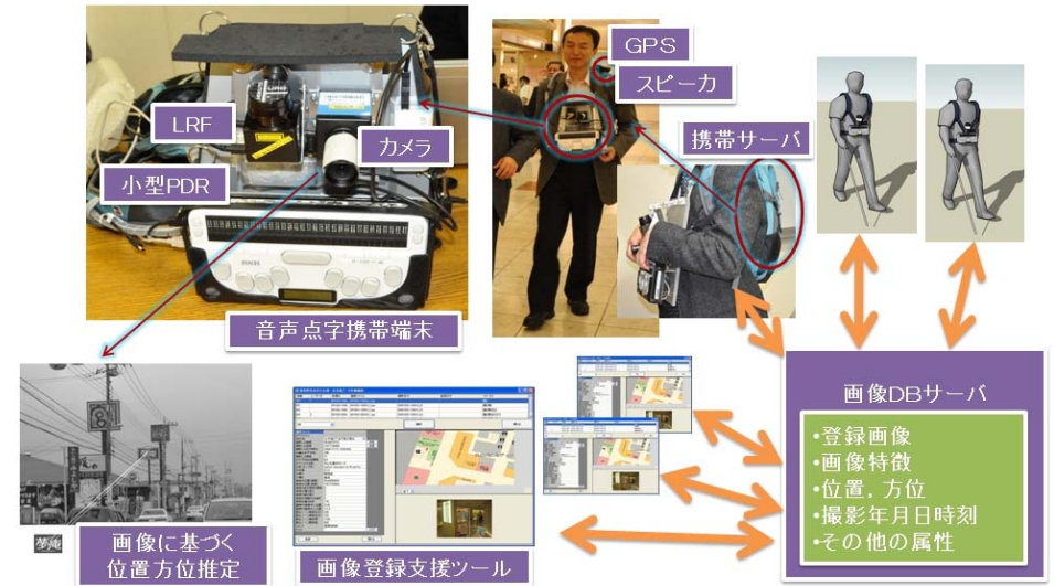
図 2.2 屋内外視覚障害者歩行支援システムの概要

視覚障害者歩行支援システムでは、現在位置や経路などのナビゲーション情報を音声と点字で利用者に提示している。また、6点式の点字キーを使って、歩行支援システムへの入力や各種操作を行えるようになっている。点字入力や点字出力、音声出力のために音声点字端末を使用している。音声点字端末は、計算処理能力が非力であるため、別途ノートPCを用意し、その上で画像認識や各センサの計算処理を行うようにした。音声点字端末にはユーザインタフェース部分のみ実装し、ノートPCは背中に背負うリュックに格納した。LRF、カメラ、小型PDR、音声点字端末は専用のハーネスに固定し、体の前の部分にぶら下げる形にした。図 2.2 に本研究で試作した屋内外視覚障害者歩行支援システムの概要を示す。