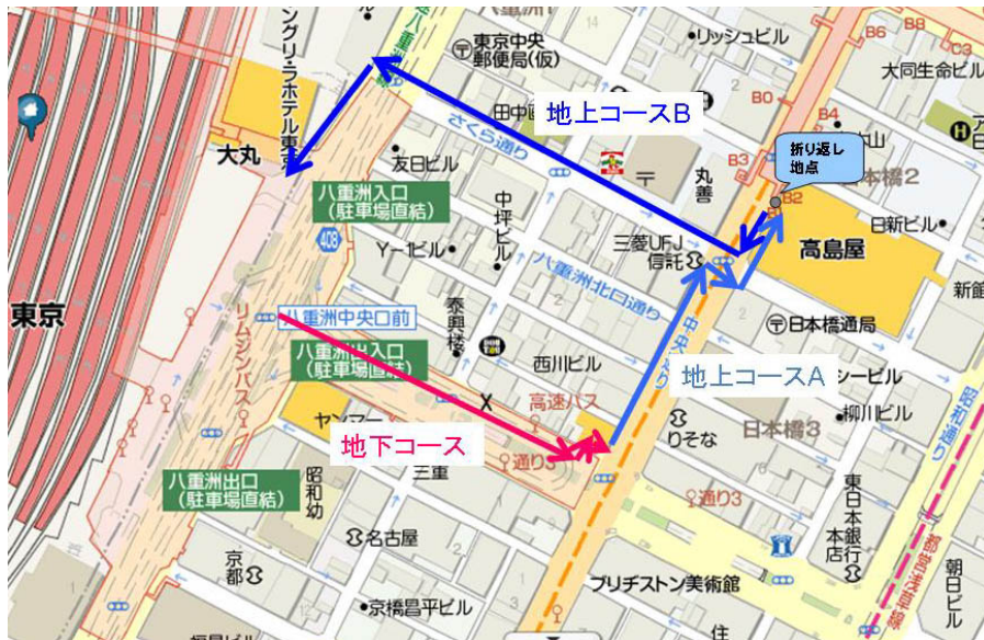
図 3.1 実験コース