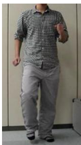
図 2. Walking

ユーザには、身体動作をしている間、常に好みの映像が閲覧できるような環境が必要となる。一方で、我々の考えるインタフェースではディスプレイはユーザの正面に置かれている。このため、ユーザが全く自由に身体動作するとディスプレイから視線が外れてしまうことになる。そこで、自然な実生活での動作を取り入れつつ、ディスプレイを常に見続けることができるようにするための制限が必要になる。ここで、制限とはディスプレイから視線が離れない範囲でユーザの身体動作を制限することである。動作認識は、ユーザの視線制限を考慮してパラメータ調整を行う。