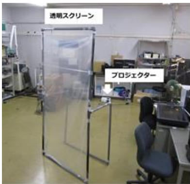
図 2 環境埋込み型カメラから見た透明スクリーンとプロジェクター