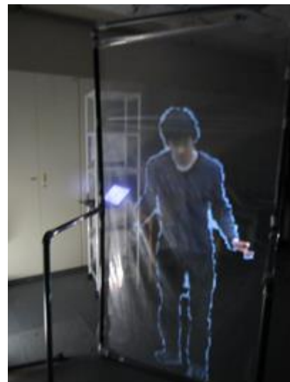
図 3 被写体の現実空間への提示

本研究の手法では、現在の空間に設置された透明スクリーンを環境埋込み型カメラから見たときの、透明スクリーンの四隅を頂点とする四辺形をまず求める。また、プロジェクターから出力される画面のうち、透明スクリーンに投影される範囲を四辺形として求める。これらの二つの四辺形は空間における透明スクリーンという同一の範囲を示している。また、これらの2つの四辺形は共に平面なので、四辺形の頂点の情報を元にしてホモグラフィ変換行列を算出できる。この算出された変換行列を元にして、3.2 節で得た前景映像をホモグラフィ変換する。これらの処理によって、図 3 のように過去の空間中における被写体の、現在の空間に設置された透明スクリーンに正しく対応した AR 提示がなされる。今後の展望として、現在は透明スクリーンの四隅を頂点とする四辺形と、透明スクリーンに投影される範囲である四辺形は手動で与えているが、透明スクリーンの移動に対応するようにこれらの二つの四辺形を自動で取得する研究を行う。これにより、透明スクリーンの移動に対応したホモグラフィ変換をリアルタイムで行う予定である。