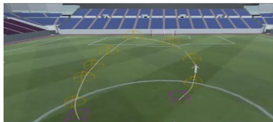
図 1: SWS による 1 選手分の軌跡表示例

選手軌跡に応じて、選手位置に 3DCG のアバダーを用意し、選手の可視化を行う。現在利用している試合記録には、選手の行動分類に関する記述がないため、軌跡から得られる情報を手掛かりに、アバダーの行動を推測し、それに従ってモーションを割り当てることを考えている。